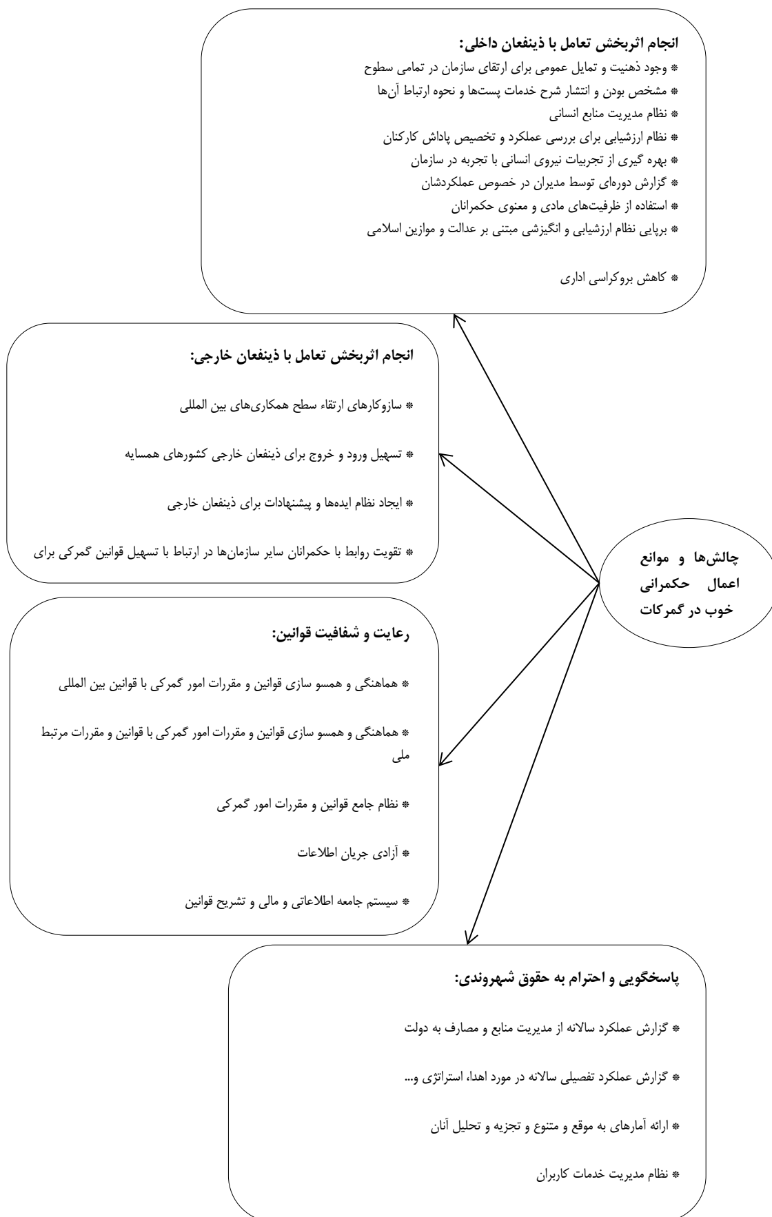
شکل ۱. یافته‌های کیفی از چالش‌های اعمال حکمرانی خوب در نظام گمرکی از دیدگاه خبرگان